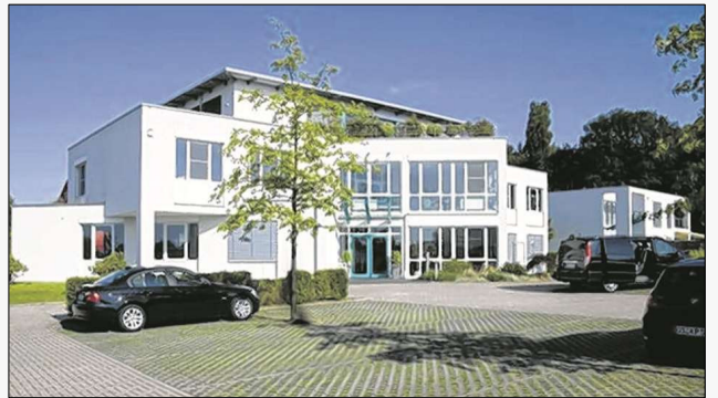
In Wallenhorst an der Otto-Lilienthal-Straße 23 steht die IT-Ideenschmiede für Personalsteuerung in Kliniken.

Das Unternehmen Klages & Partner von der Otto-Lilienthal-Straße 23 in Wallenhorst hat sich längst als Strategie für Beratung und Schulung für IT-Lösungen im Krankenhauspersonalwesen einen Namen gemacht. Nicht nur bei den Auftraggebern. Externe Gremien haben Gütesiegel verteilt. Das des „Kundenchampions 2009“ ist eines. Eine weitere Besonderheit ist die aus dem Jahr 2010: Klages & Partner erhielt zum dritten Mal in Folge die Auszeichnung als Top-Arbeitgeber. Vorausgegangen waren eine detaillierte Mitarbeiterbefragung und die schriftlich fixierte Verpflichtung von Klages & Partner zum Umgang mit den Mitarbeitern auch in wirtschaftlich schwierigen Zeiten. Weitere Zertifikate erhielten die Wallenhorster für finanzielle Sicherheit (im Jahr 2007) und als „Deloitte Technology Fast50“ (im Jahr 2005) für schnelles Wachstum als eines von 50 Unternehmen in Deutschland. gre