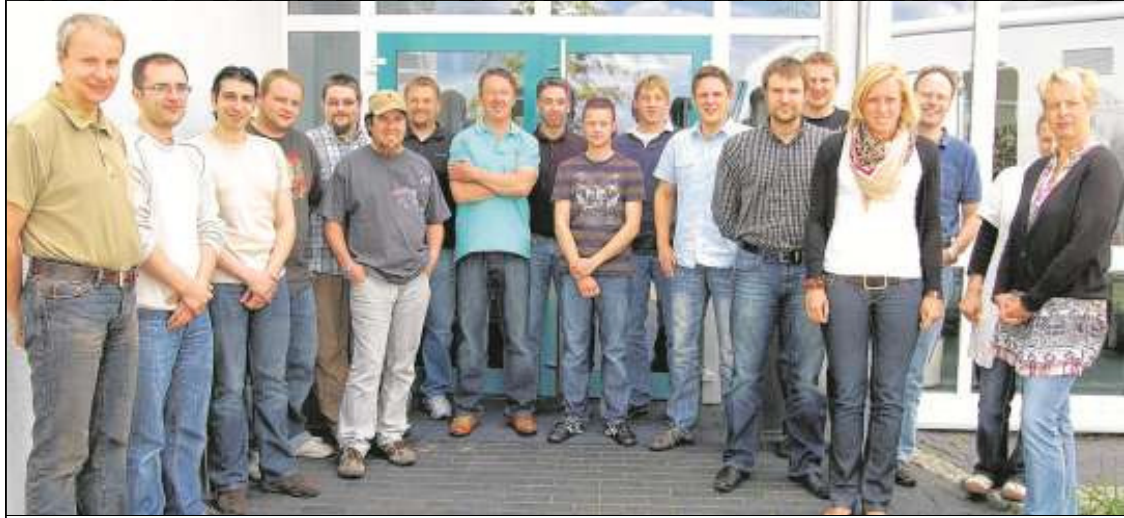
Ein motiviertes kompetentes Team ist bei Klages & Partner die Garantie für Service und Qualität.